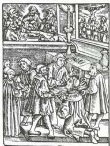
'Bediening van het avondmaal', houtsnede in: Das Babstsche Gesangbuch , 1545

In de eerste eeuwen ontwikkelde de liefde-maaltijd ( agapè -maaltijd) naar het voorbeeld van de Pesach-maaltijd zich tot een zelfstandig ritueel als dankzegging ( eucharistie ) voor het offer van Christus. In de vierde en vijfde eeuw gebeurde dat staande. Kerkvader Augustinus had niet eens stoelen of banken in zijn gebouwen van samenkomst. Kerkgangers liepen naar de priester om individueel de hostie te ontvangen, en dat bleef zo in de middeleeuwen. In de Reformatie veranderde het offerkarakter van de eucharistie. Christus had het offer immers al gebracht. Het altaar maakte plaats voor een eenvoudige tafel. Luther en Calvijn vierden het waarschijnlijk nog lopend en zagen, anders dan in de calvinistische traditie, het liefst elke samenkomst van gelovigen een maaltijdviering.