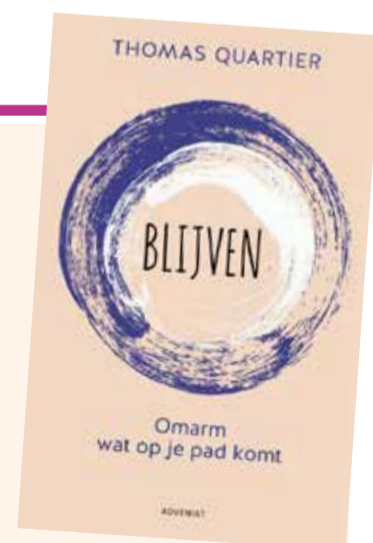
Thomas Quartier, 'Blijven. Omarm wat op je pad komt', Baarn: Adveniat, 2022, € 19,95