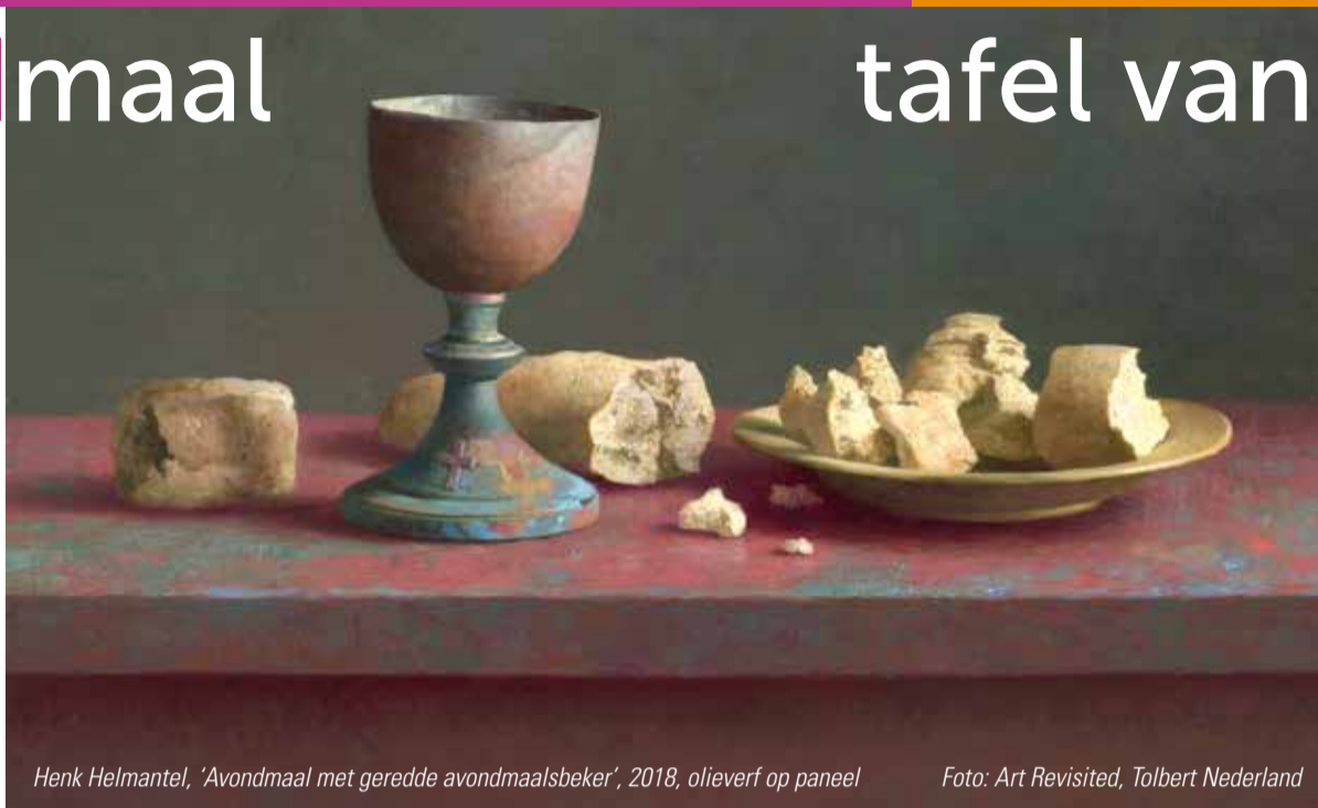
Henk Helmantel, 'Avondmaal met geredde avondmaalsbeker', 2018, olieverf op paneel